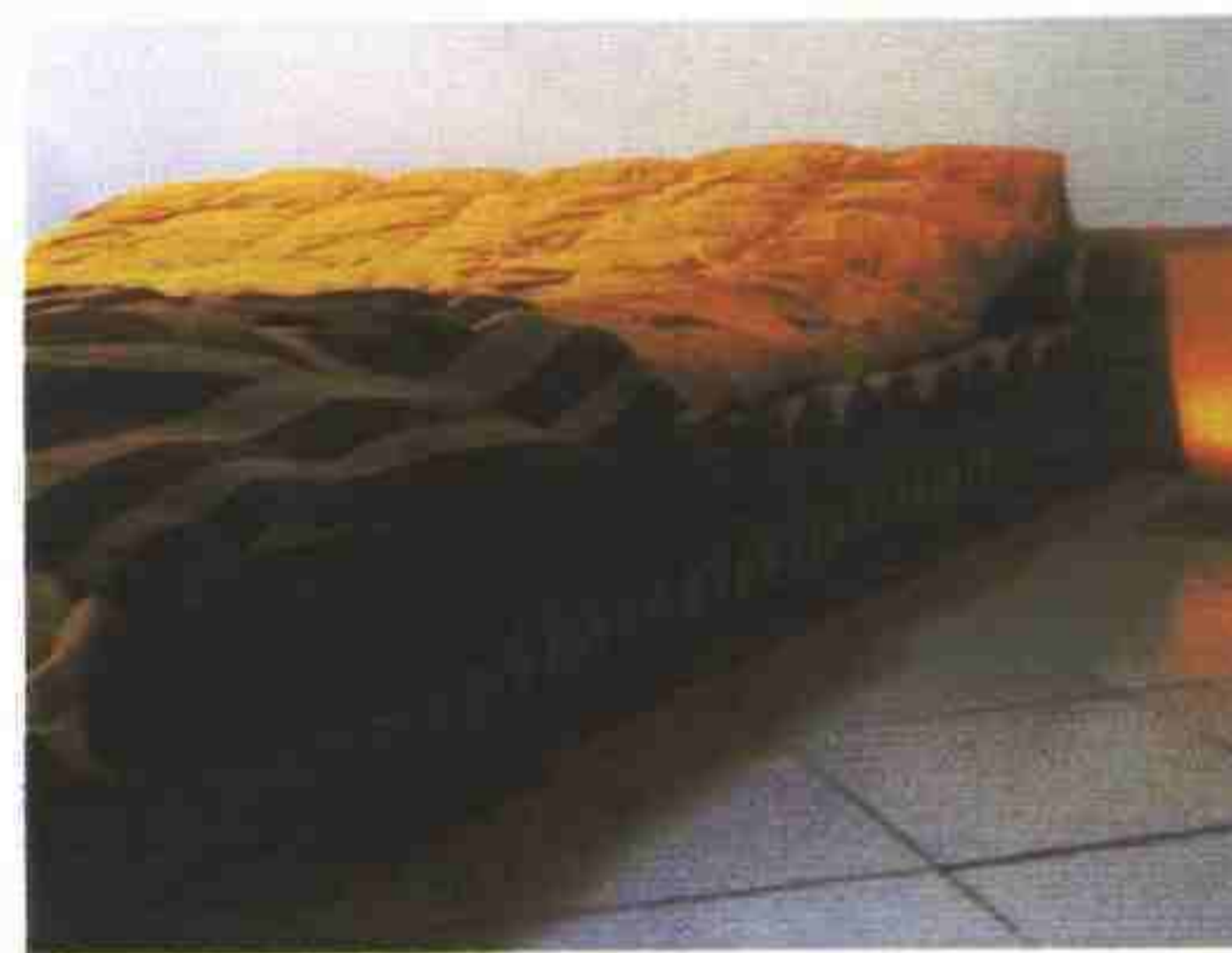
Il letto assemblabile è interamente realizzato con tubi in cartone. Misura 200x200 cm. Tubed di Duroni Luigi.