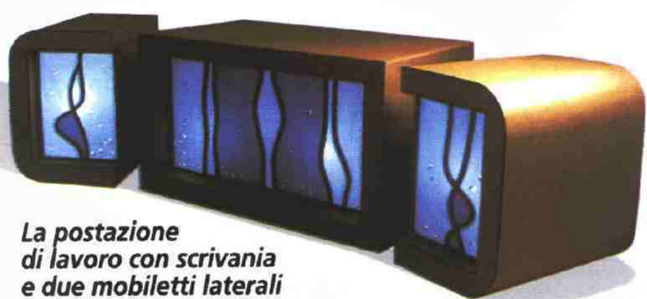
La postazione di lavoro con scrivania e due mobiletti laterali è realizzata in cartone e carte evanescenti traslucide riciclate. Ambo di S.I. Servizi Industriali.

Designer, artigiani e artisti propongono una serie di mobili e oggetti realizzati con materie prime naturali o riciclate e processi produttivi meno inquinanti.