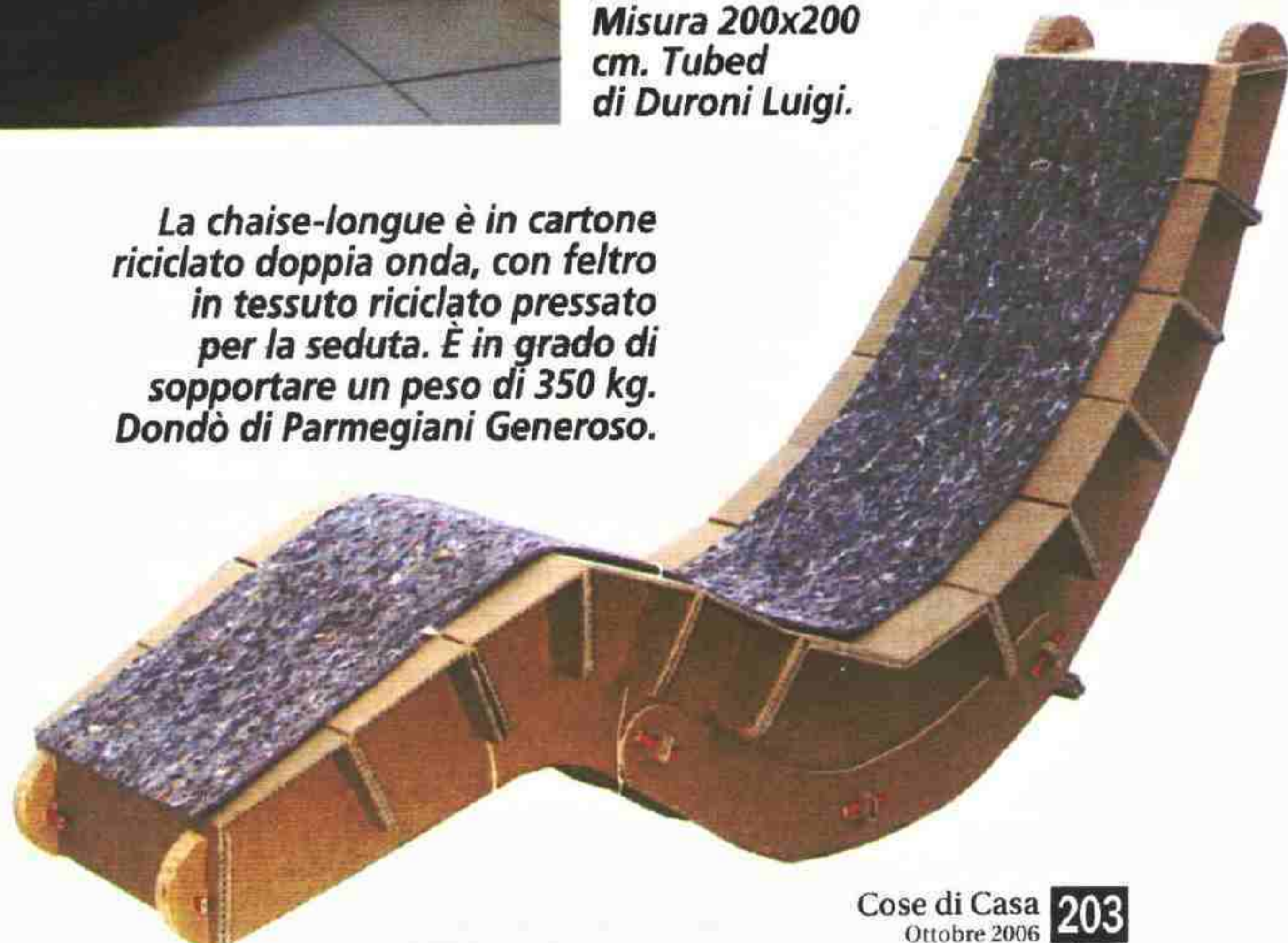
La chaise-longue è in cartone riciclato doppia onda, con feltro in tessuto riciclato pressato per la seduta. È in grado di sopportare un peso di 350 kg. Dondò di Parmegiani Generoso.