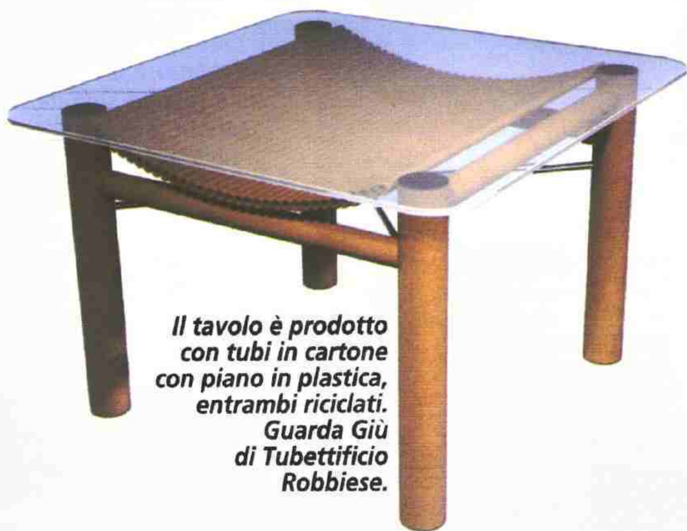
Il tavolo è prodotto con tubi in cartone con piano in plastica, entrambi riciclati. Guarda Giù di Tubettificio Robbiese.