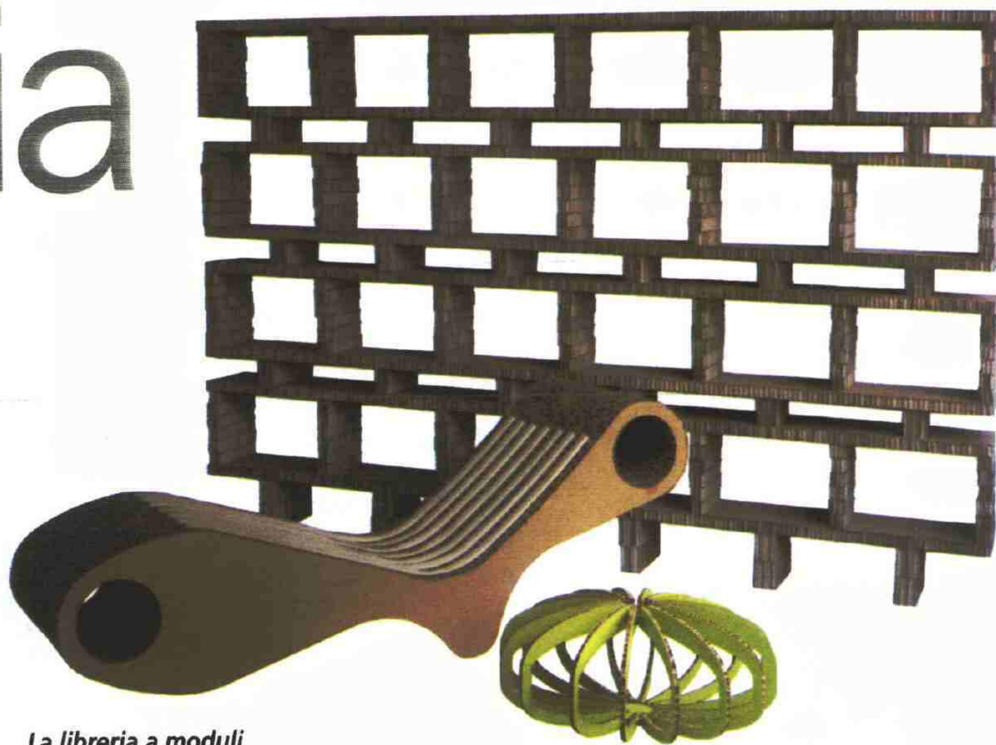
La libreria a moduli Bookstack, la chaise-longue Wanda e l'oggetto da appendere Riccio, in cartone alveolare riciclato, sono tutti prodotti da A4A.